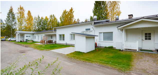
PÄIVÖLÄN JA PELTOLAN PALVELUTALO