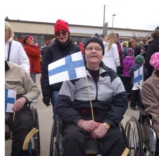
Sauli Niinistöä kuuntelemassa