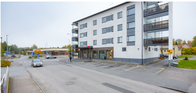
AS OY KARSTULAN LINNUNLAULU