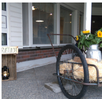
Omaisten illassa Kotipirtissä