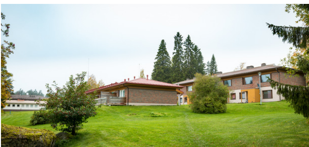
ENONRANNAN JA ENONRINTEEN RIVITALOT