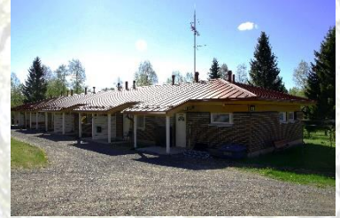
ENONRANNAN ESTEETTÖMÄT RIVITALOASUNNOT