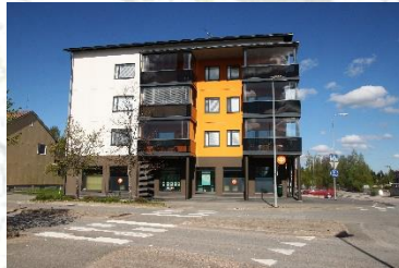
AS OY KARSTULAN LINNUNLAULU