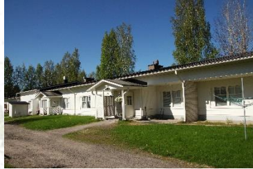
PÄIVÖLÄN JA PELTOLAN PALVELUTALO